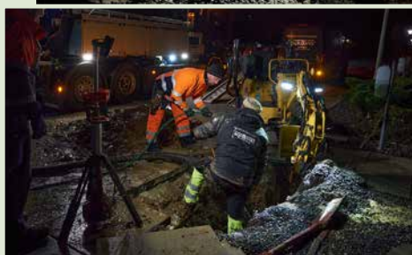
Reparation på drikkevandsforsyningen i de forreste huse i afd. 3 på Ringgade.

Tirsdag var den gal igen, men nu ved de bagerste rækkehuse i afd. 3 på Ringgade.