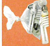
Sparepærer i pose