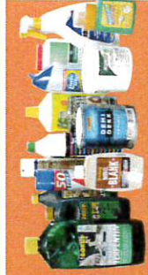
Kemikalier, og tomme kemikaliebøtter, lightere, maling, opløsningsmidler, rengøringsmidler og spraydåser

OBS! Medicin og kanyler må ikke kommes i miljøkassen, men skal afleveres på Apoteket.