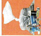
Batterier i pose